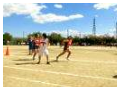
クラブ対抗リレー