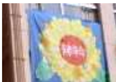
島二生徒会のシンボル「ひまわり」