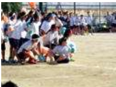
生徒会によるオープニング